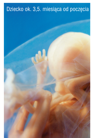
Dziecko ok. 3,5. miesiąca od poczęcia